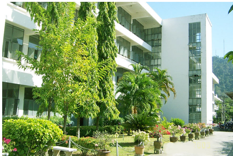
แผนกเทคนิควิศวกรรมหมืองแร่และสิ่งแวดล้อม และแผนกเทคนิคพื้นฐาน