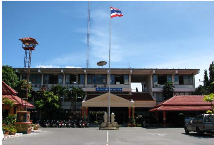
อาคารอำนวยการ