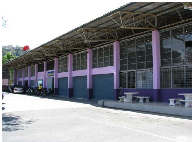
แผนกวิชาช่างยนต์