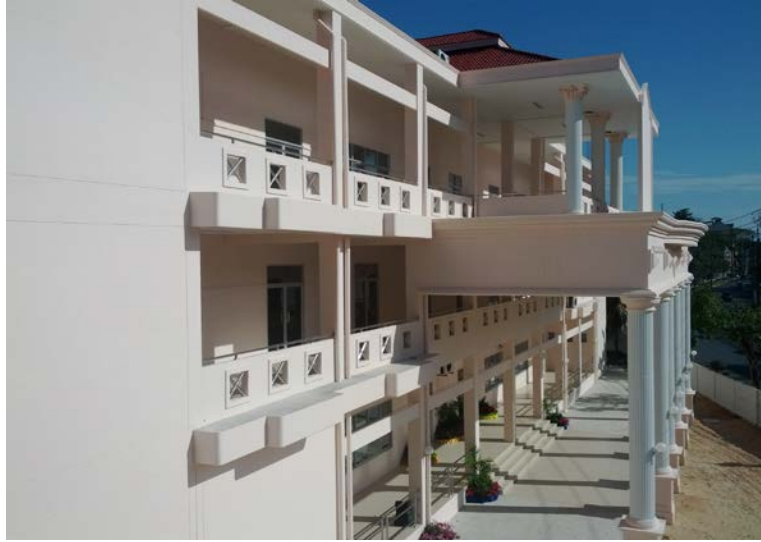
อาคารวิทยบริการและห้องสมุด