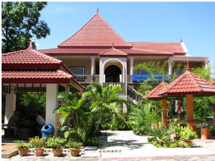
แผนกวิชาเทคโนโลยีสารสนเทศ