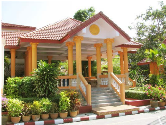
ศาลานั่งพักผ่อน