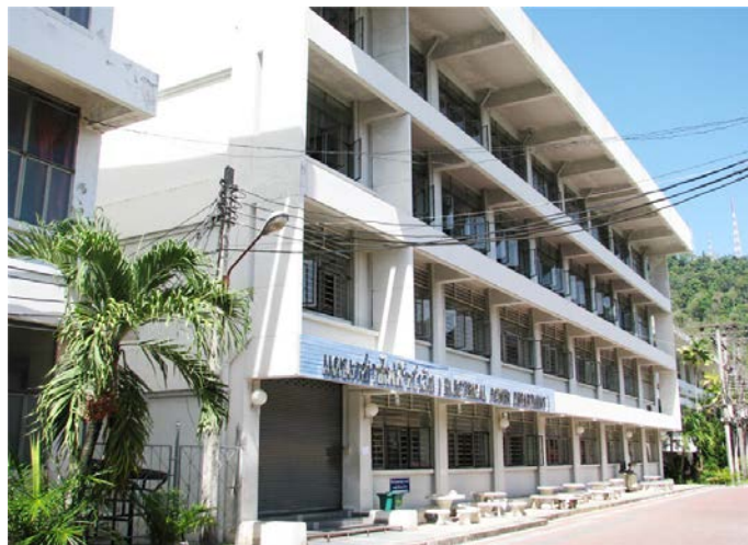
แผนกวิชาช่างไฟฟ้า