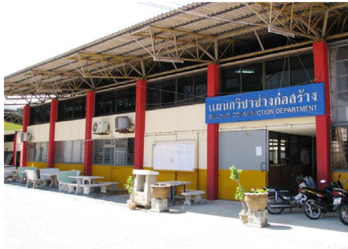
แผนกวิชาช่างก่อสร้าง