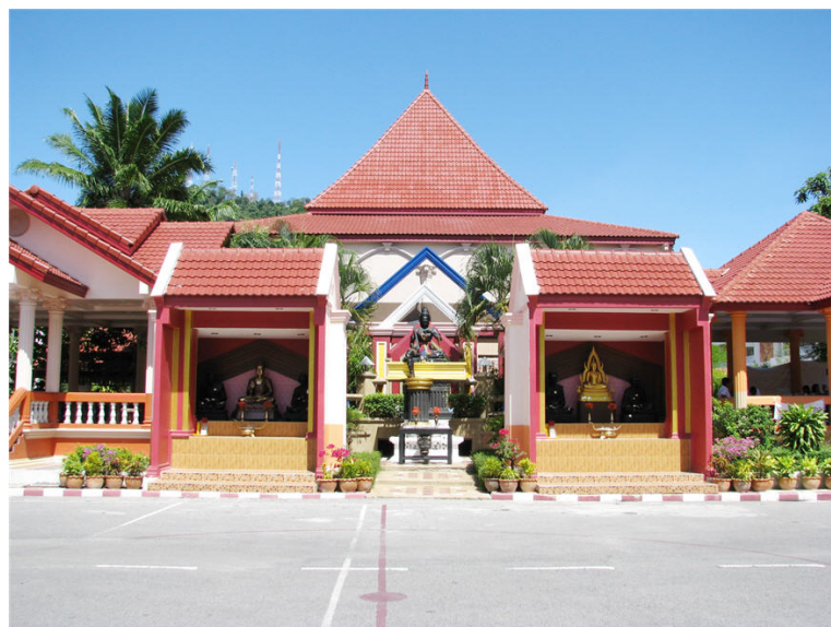
บริเวณลานหลวงปู่และพระวิษณุกรรม