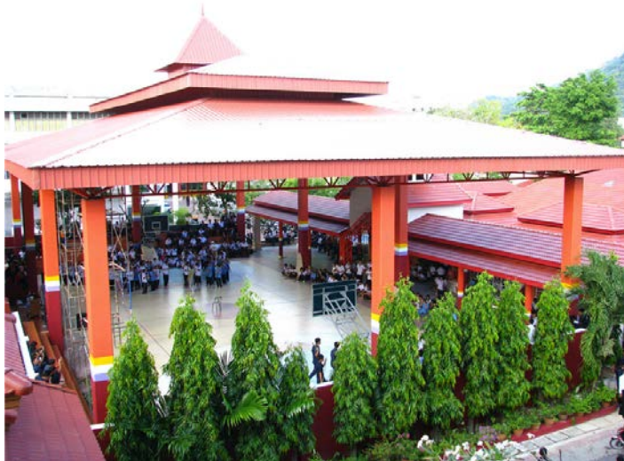
อาคารอยู่สี่มารักษ์ยิม