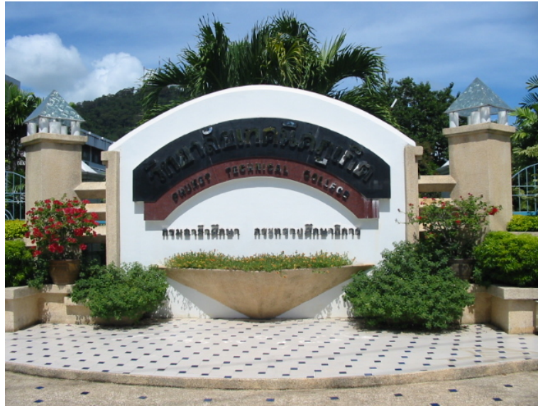
ป้ายวิทยาลัยเทคนิคภูเก็ต