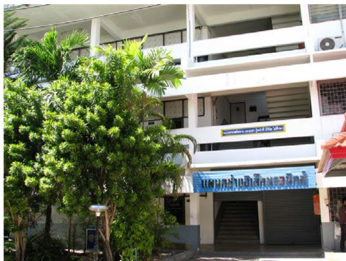
แผนกวิชาช่างอิเล็กทรอนิกส์