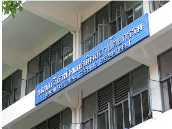
แผนกวิชาช่างเทคนิคสถาปัตย์กรรม