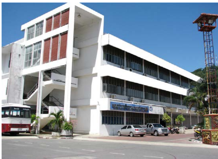
แผนกวิชาช่างกลโรงงาน